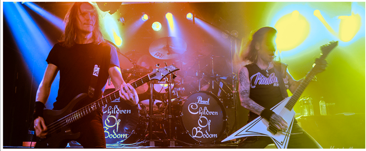
Alexi Laiho th med Children of Bodom